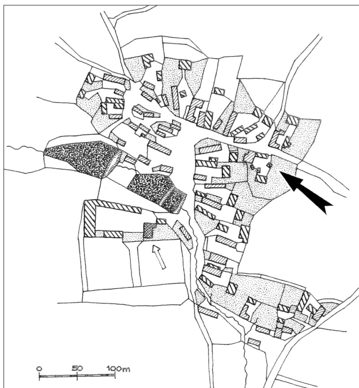
Obr. 4. Obec Pole na stabilním katastru z r. 1837. Černou šipkou označeno místo nálezu kachlů, prázdnou šipkou poloha renesančního zámku