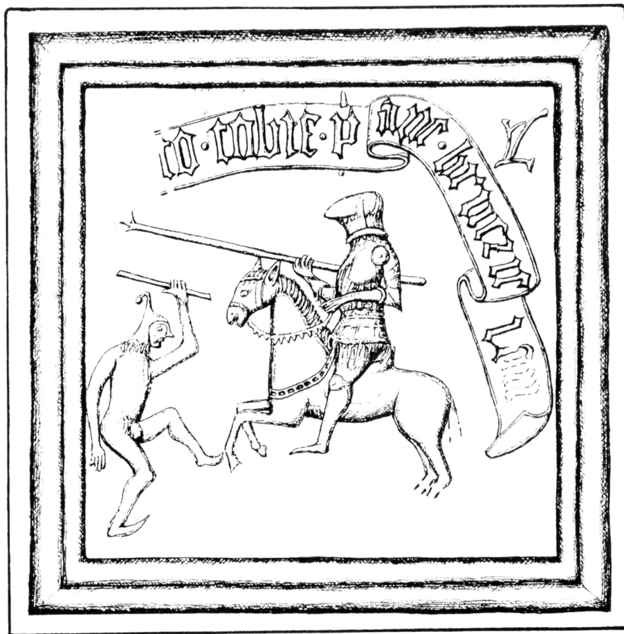
Obr. 3. Maximální možná kresebná rekonstrukce studovaného reliéfu, zhotovená pomocí zlomků z obcí Pole a Újezd.