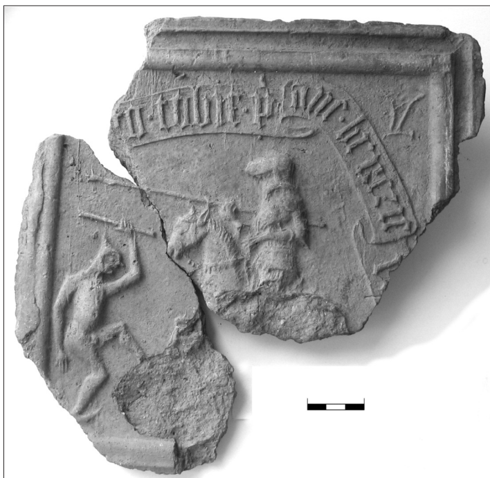
Obr. 1. Reliéfní komorový kachel s turnajovou scénou a nápisovou páskou s dedikačním textem z obce Pole. Městské muzeum Blatná, inv. č. A 584 a+b