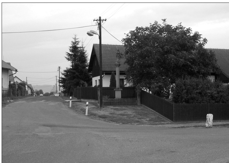
Obr. 1. Čejkovice (okr. Jičín). Mariánský sloup ve středu obce (po opravě v roce 1992). Pohled od jihovýchodu

Po rozebrání pískovcových stupňů byly objeveny kosterní pozůstatky několika jedinců. Byla tím potvrzena zpráva majitele čp. 19 (usedlost severně a západně od sloupu), který na svém sousedícím pozemku rovněž našel kosti dospělých jedinců. Při stavbě plotu v 70. letech 20. století vykopal v rýze pro podezdívku plotu dlouhé kosti a část pánve dospělého člověka. Pokud mohl zjistit, tento pohřeb byl orientován hlavou k severu. Při obdělávání zahrádky severně od mariánského sloupu nacházel opakovaně drobné lidské kosti. Do jičínského muzea předal v tomto místě nalezený měděný krejcar ražený roku 1861. U stodoly vykopal zlomky nádob a železnou sečnou či bodnou zbraň.