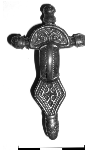
Obr. 2. Stehelčevs, okr. Kladno. Hrob 2, spona

Spony s ptačími hlavičkami (Koch 1998, typ VII.2.2-Gruppe B). Stejnou výzdobu nožky vykazuje pár stříbrných pozlacených spon z hrobu 192 z Villingendorf, Ldkr. Rottweil. Od spínadel t. Oberwerschen se liší právě jen záhlavní částí spony (obr. 3:7; Frank 2008, Abb. s. 41). K uvedenému páru lze počítat i sponu z hrobu 46 z Villey-Saint-Étienne, Dép. Meurthe-et-Moselle (obr. 3:6; Koch 1998, 396–399, 653, Taf. 50:15). Její nožka je zdobena týmž motivem, byť v poněkud geometrizujícím stylu. 8