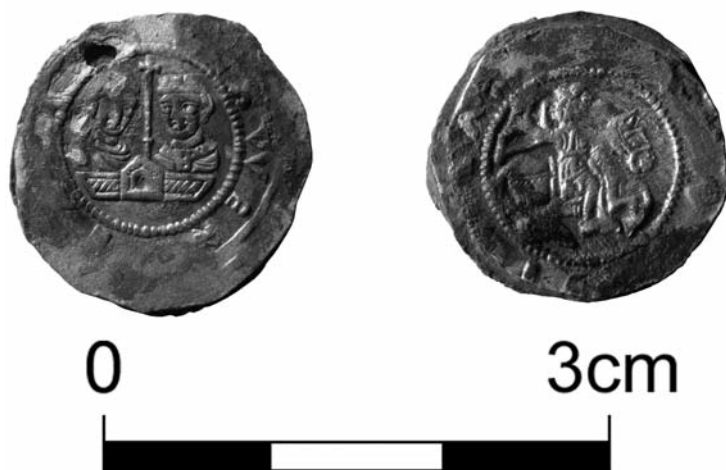
Obr. 5. Břevnovský klášter, hrob 3. Vlevo revers mince kat. NPÚ č. 200, vpravo avers č. 201.