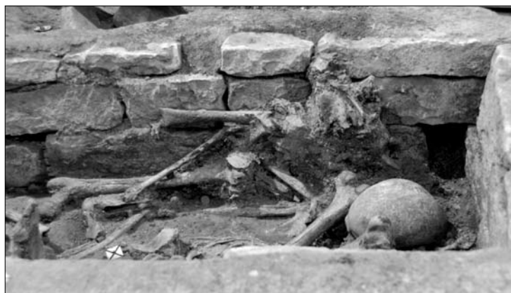
Obr. 3. Břevnovský klášter. Detail hrobu 2 v pohledu od severu.

Neurčený AR denár, zatím nepřístupný, 16/17 mm, katalog NPÚ č. 202.