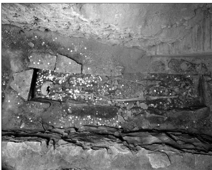
Obr. 4. Břevnovský klášter. Hrob 3. Stav před čištěním.