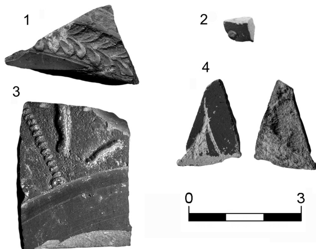
Obr. 2. Zlomky terry sigillaty ze středočeských lokalit.

Uložení: ARÚ Praha (výzkum Tišice 2007, sáček č. 356).