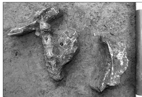
Obr. 2. Praha-Velká Chuchle, hrob 98. Zvířecí pozůstatky.