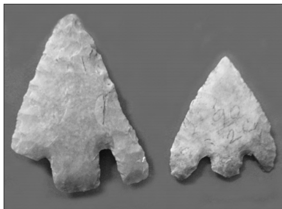
Obr. 4. Šipky z Windmill Hill, Wiltshire