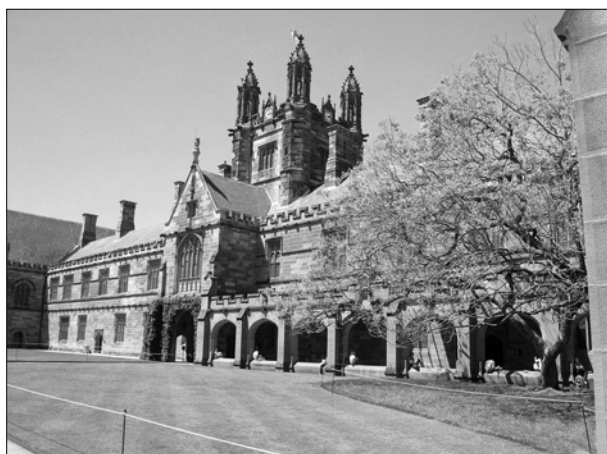
Obr. 1. University of Sydney, budova v níž sídlí Nicholsonovo muzeum