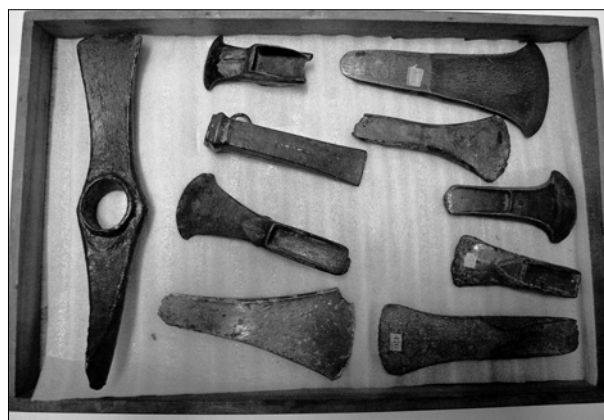
Obr. 2. Nálezy bronzové industrie ze střední Evropy ve sbírkách Nicholsonova muzea v Sydney