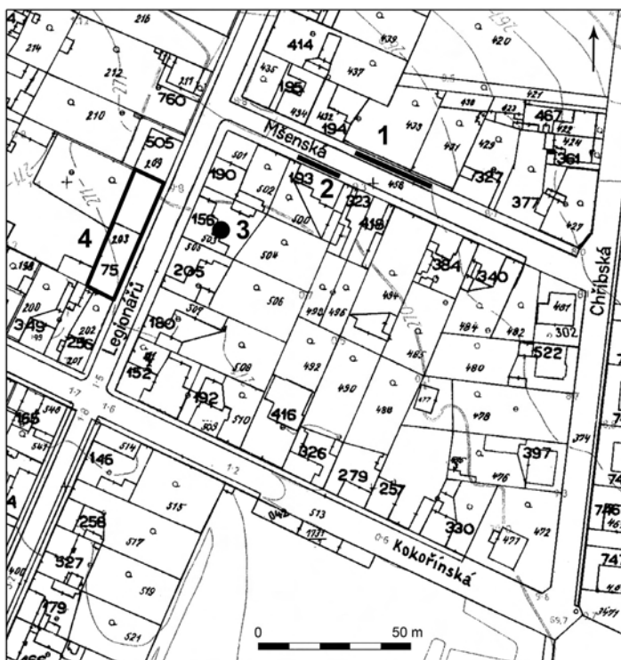
Obr. 1. Praha-Žáblice. Plán části intravilánu s polohami časně eneolitických nálezů: 1 – ul. Mšenská mezi domy čp. 194 a 327 ( Kovářik 1982 ); 2 – ul. Mšenská u domu čp. 193 ( Mašek 1967 ); 3 – okolí domu čp. 156 ( Axamit 1925 ); 4 – ul. Legionářů ppč. 203/5 ( Kostka 1999 )

Sídliště v Mšenské ulici se rozkládalo na mírném svahu žáblického návrší skloněném k severovýchodu, v nadmořské výšce 269,5 m n. m. Podloží zde tvoří pleistocénní eolické a deluvioeolické sedimenty – spraše a sprašové hlíny ( Kovanda