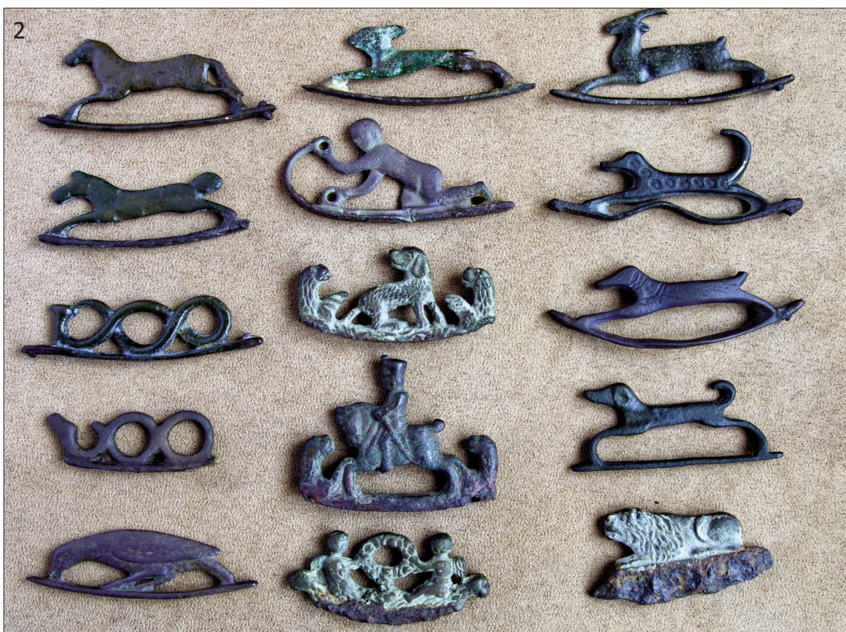
Fototab. 22. Ukázka některých typů a variant držadel ocílky (k článku Ondřeje Černoorského Studie o zoomorfních a antropomorfních držadlech ocílky , str. 1063–1145)