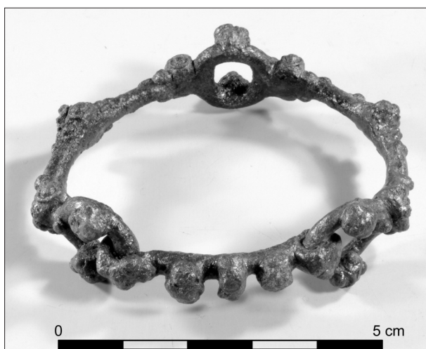
Obr. 3. Praha-Nové Město, ul. Na Slupi. Atypický náramek z laténského hrobu H 23 (stav po konzervaci)