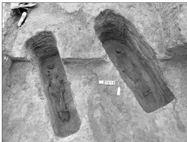
Obr. 2. Praha-Nové Město, ul. Na Slupi. Laténské hroby H 22 a H 23