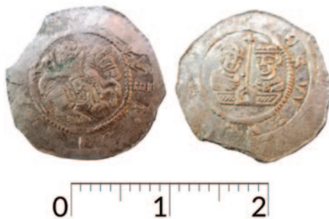
Obr. 4. Denár Cach 562 z nálezu Libotov 1941. Fotodokumentace ze sbírek Muzea východních Čech v Hradci Králové (podle Lukas 2019 ).

Mince z břevnovského nálezu mají na rubové straně mezi postavami světců procesní kříž a postrádají u hlav písmena E, patří tedy nejběžnější variantě I. Srovnáme-li rub břevnovského denáru č. 200 s nedávno odkrytým rubem denáru č. 202, najdeme drobné rozdíly. Jednak se hlava sv. Václava na denáru 200 nedotýká žerdě kříže, jako je tomu na denáru č. 202, žerď také není umístěna v ose brány, ale prochází geometrickým středem perlovce. Rozdělovací znaménko na rubu denáru č. 200 je buď nedo-