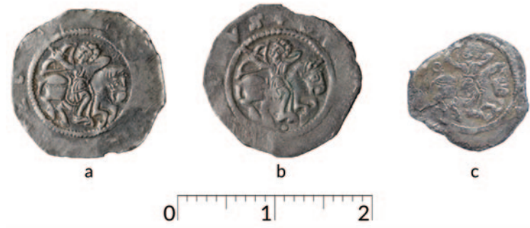
Obr. 2. Lící strany denárů Cach 562. Z nálezu Bzová 2020: a) varianta I (kat. č. 8), b) varianta II (kat. č. 23), c) varianta III (kat. č. 29), převzato z Lukas 2019 , obr. 5 na s. 12. Z nálezu z břevnovského klášteře 2009: d) kat. NPÚ č. 200, e) č. 201. Na slepenci 201 + 202 je zřetelné, že spodní mince č. 202 je větší než č. 201.