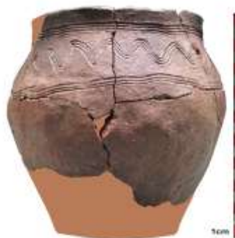
Hoštice (Praha-východ), parc.č. 580

Jedná se o polozemnici s pozůstatky kamenné pece v severozápadním rohu. V těsné blízkosti tohoto otopného zařízení se nacházely fragmenty tří keramických nádob.